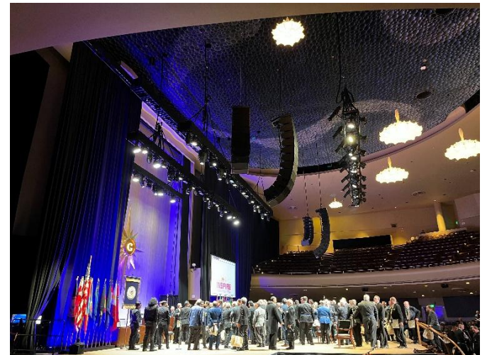
大會禮堂及舞台 Auditorium and Stage