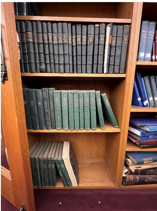
Archives of District GL of China 中國區總會會議報告